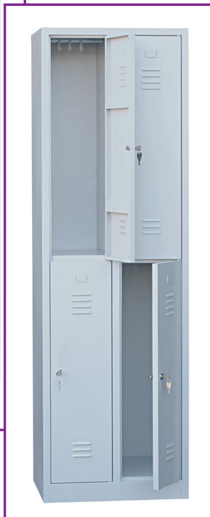
2 x 2 Türen